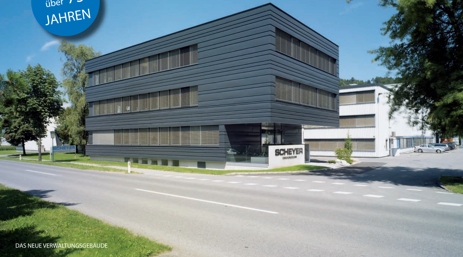
DAS NEUE VERWALTUNGSGEBÄUDE