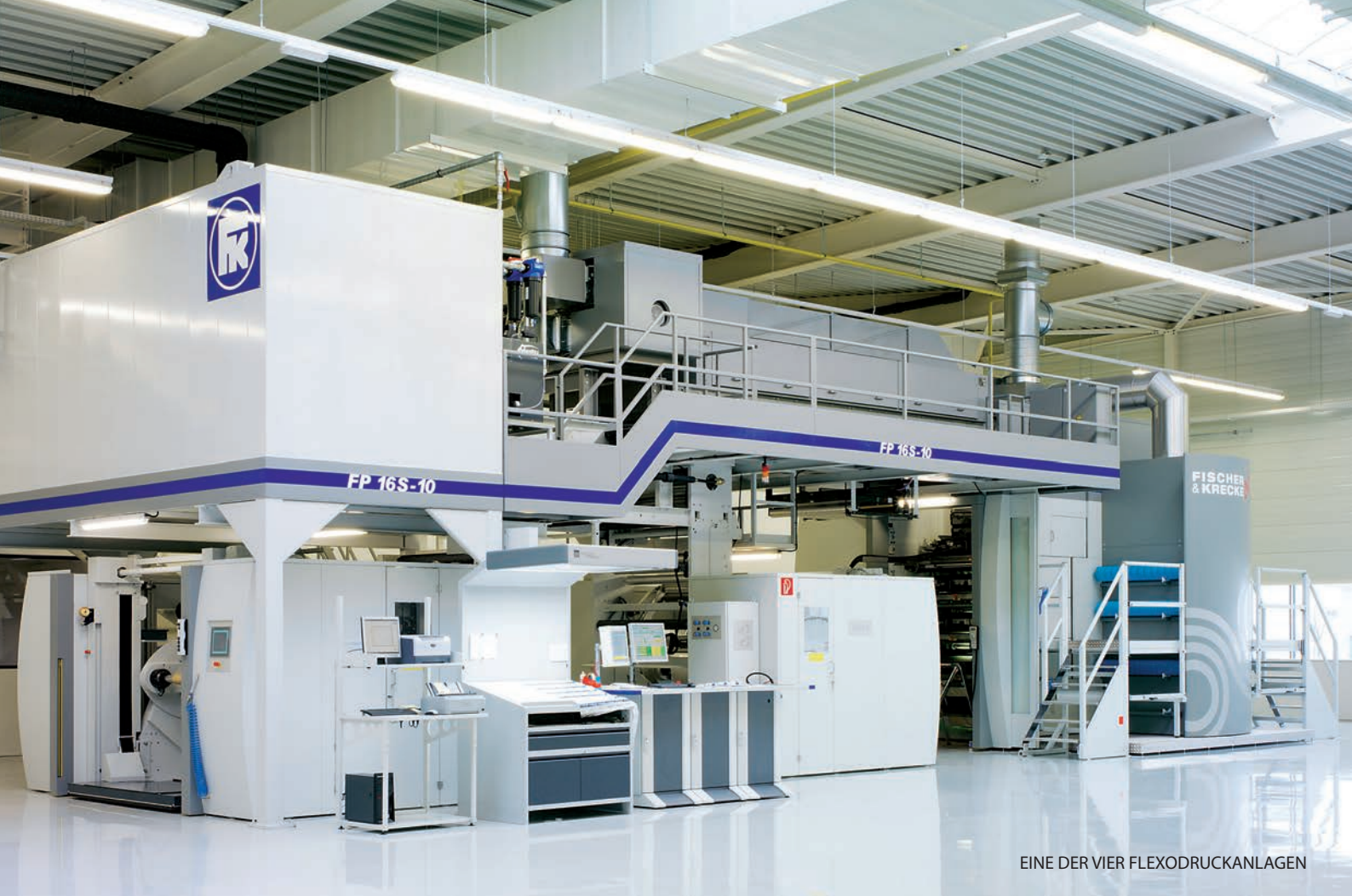
EINE DER VIER FLEXODRUCKANLAGEN